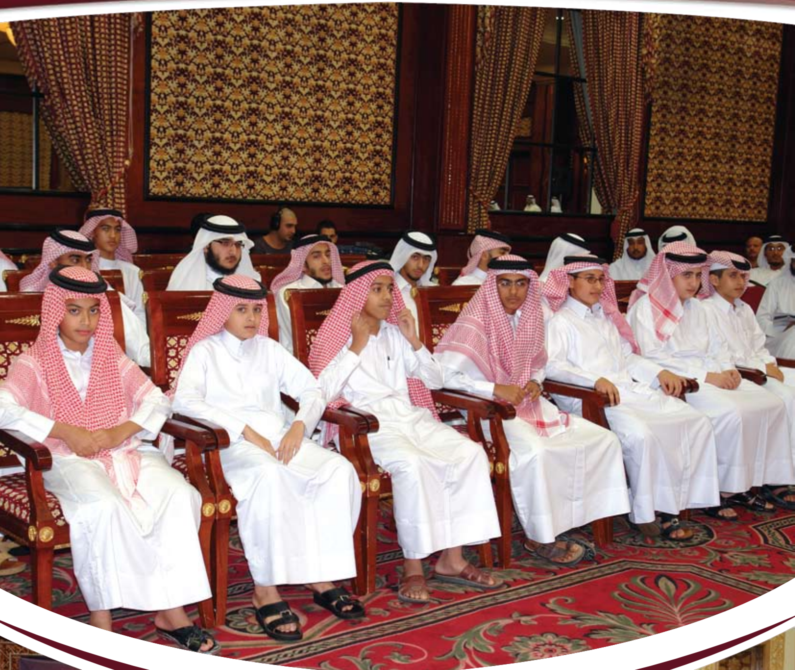
حفل تكريم لحفاظ القرآن الكريم