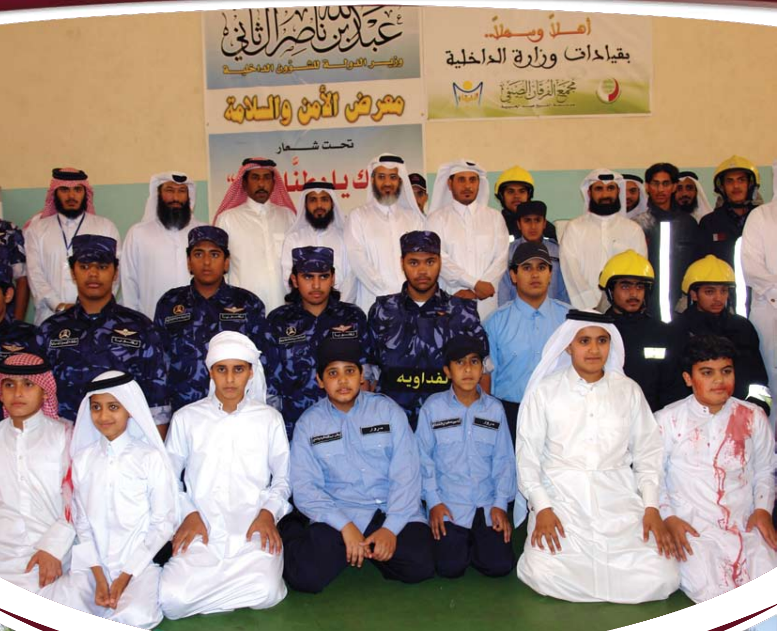
سعادة وزير الدولة للشؤون الداخلية ومدير عام المؤسسة بمعرض الأمن والسلامة