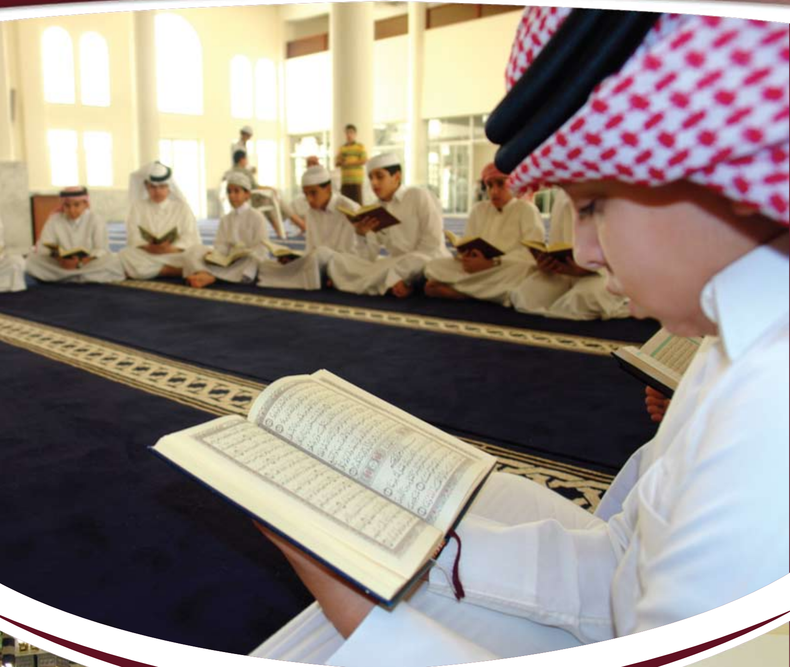
حلقة من حلقات الاتقان بجامع المنع