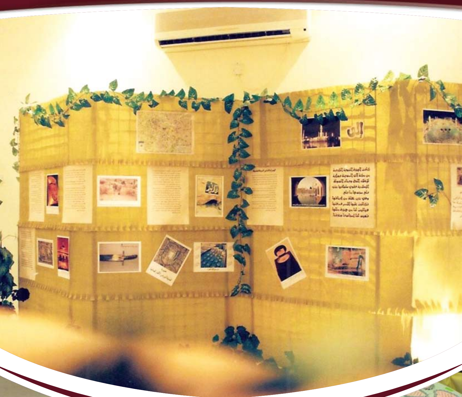
معرض حجابي نجاتي