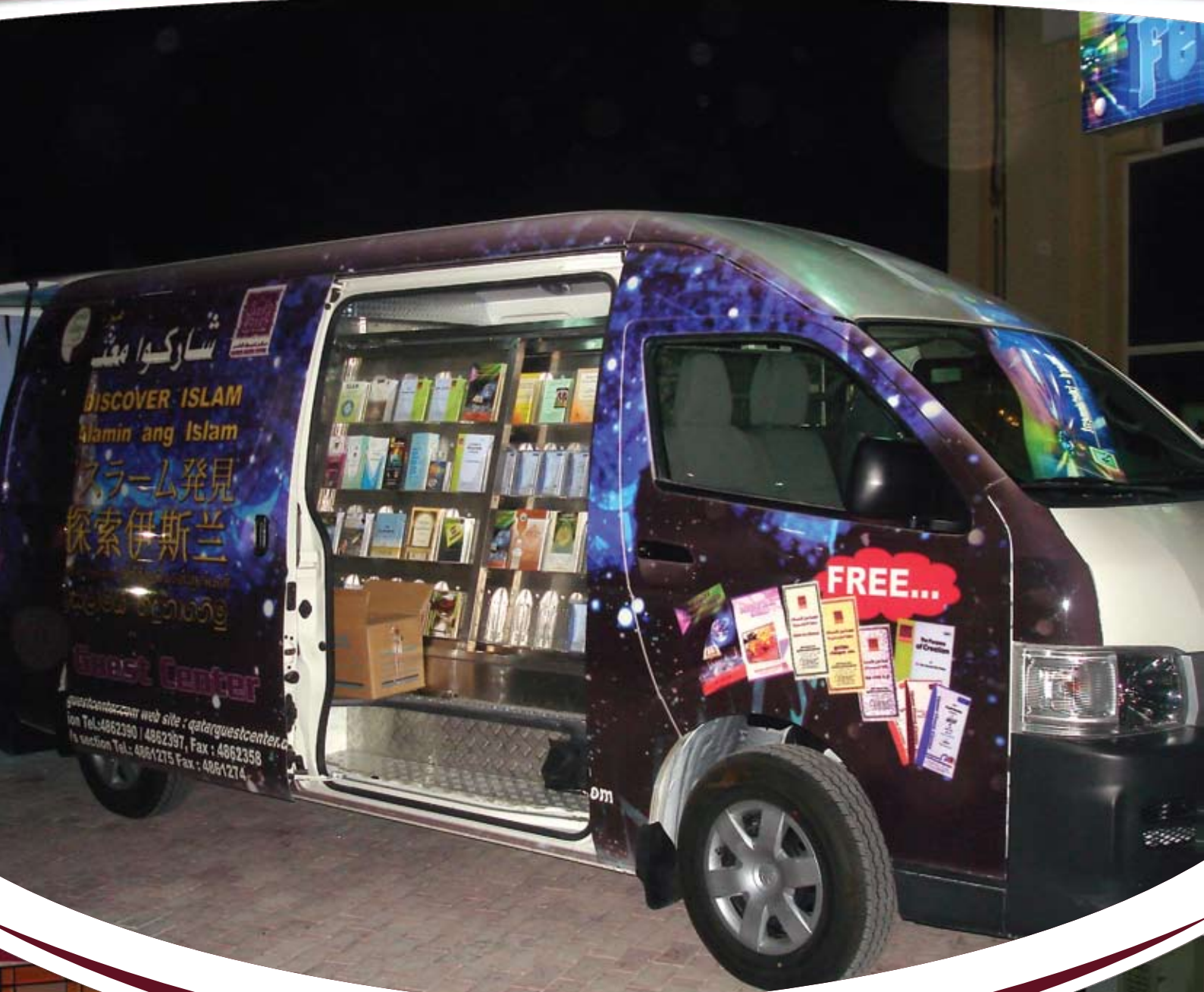
السيارة الدعوية للجاليات