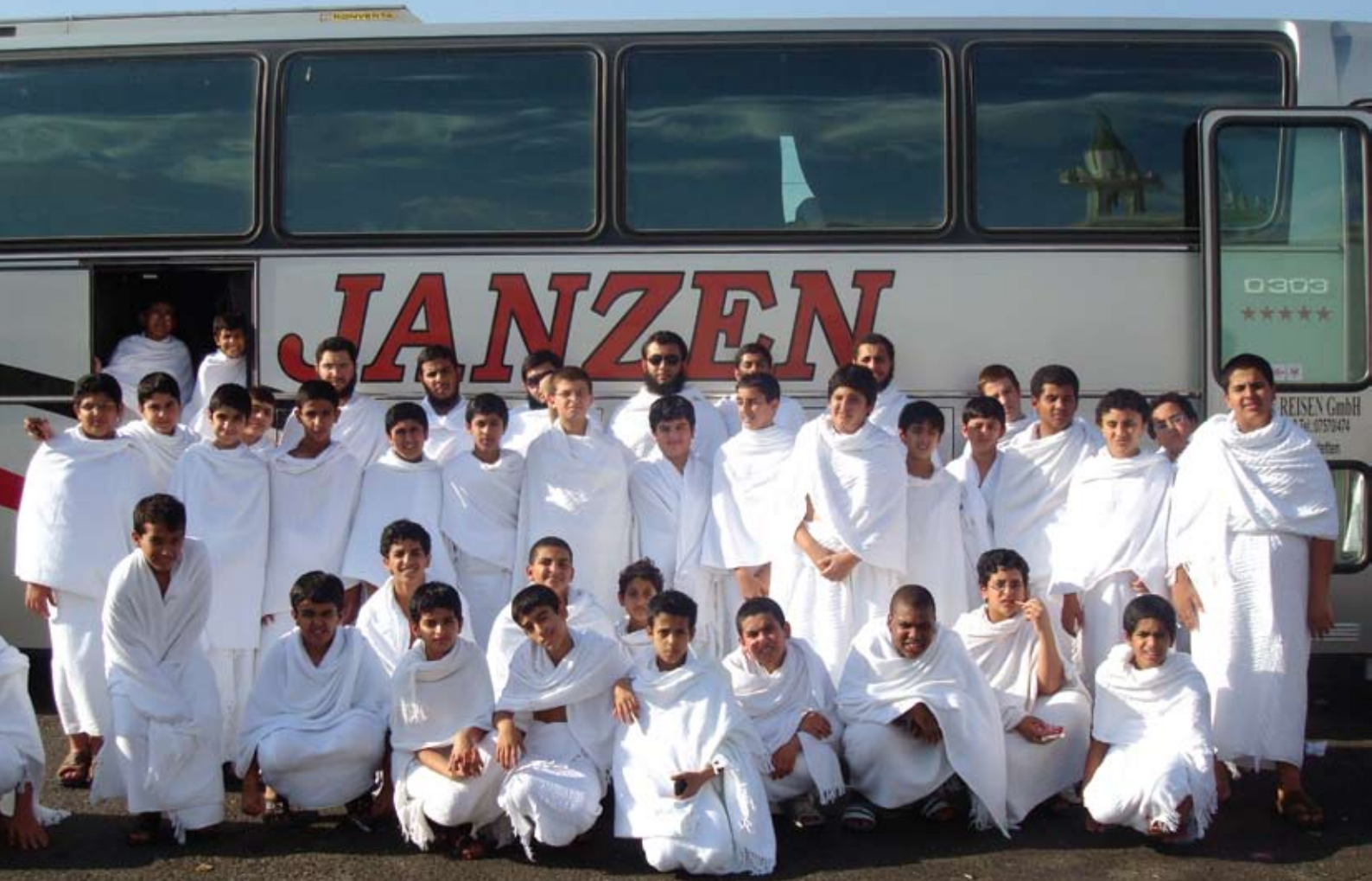
رحلة العمرة لطلاب الفرقان الصيفي الإعدادي