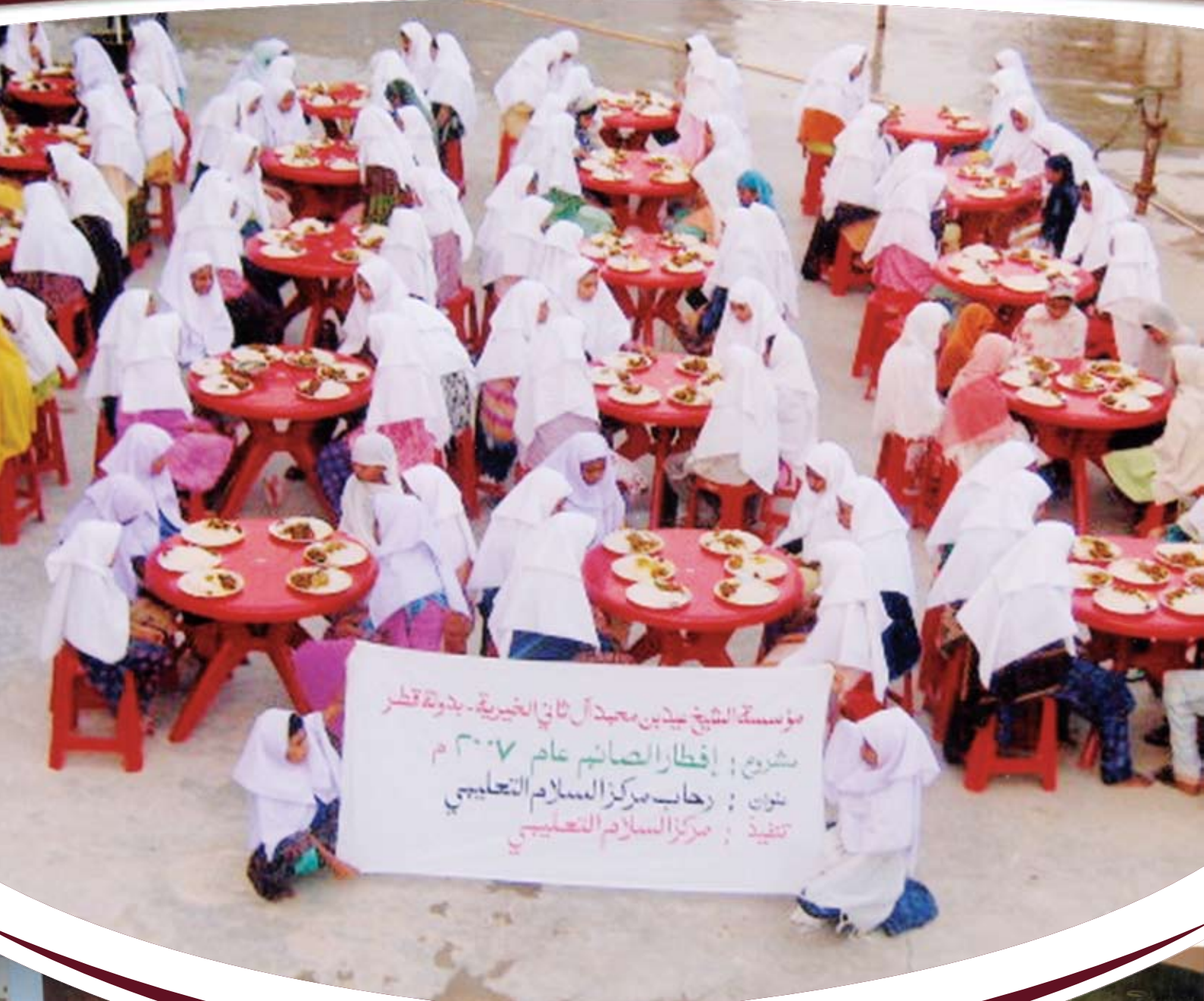
مشروع افطار صائم خارج قطر