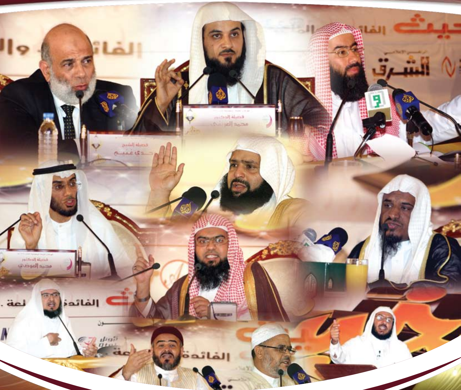
ضيوف مهرجان الخيمة الرمضانية :: نسائم الخير (٣) ::