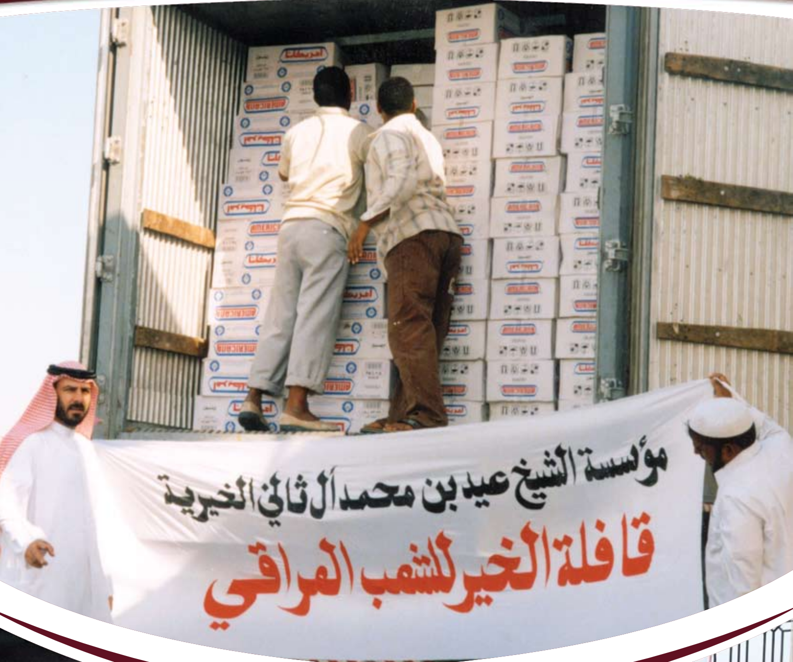
تبرعات عينية من أهل قطر للشعب العراقي