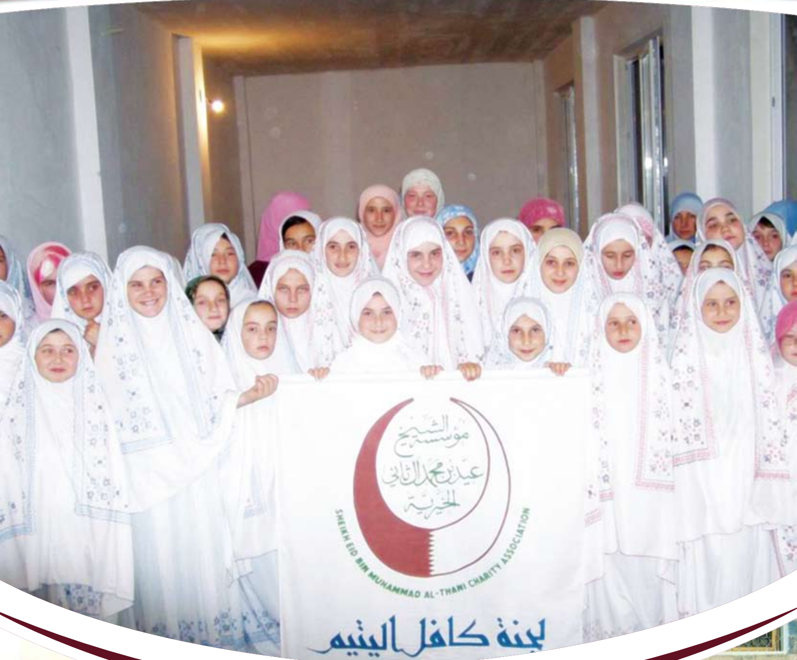
تكرم الأيتام بالدورة الشرعية