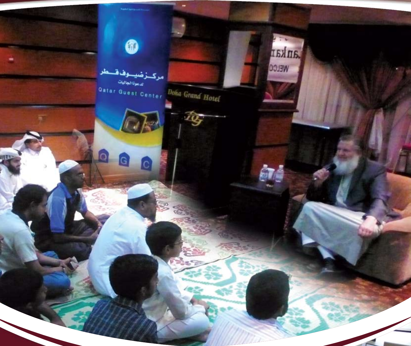
لقاء مع الداعية يوسف استنس