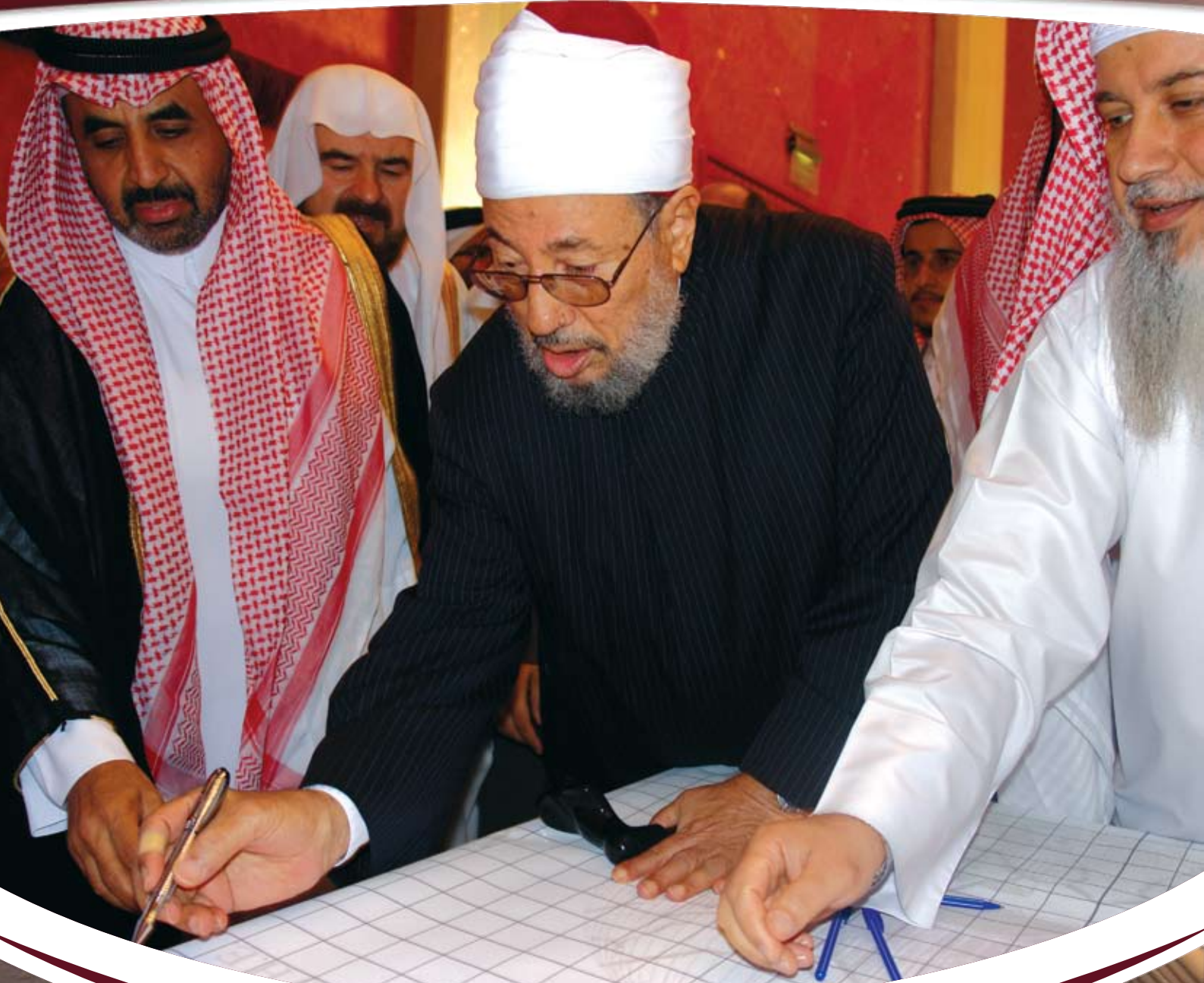
فضيلة الشيخ د. يوسف القرضاوي مع الشيخ د. محمد بن عيد أثناء تدشين حملة المليون