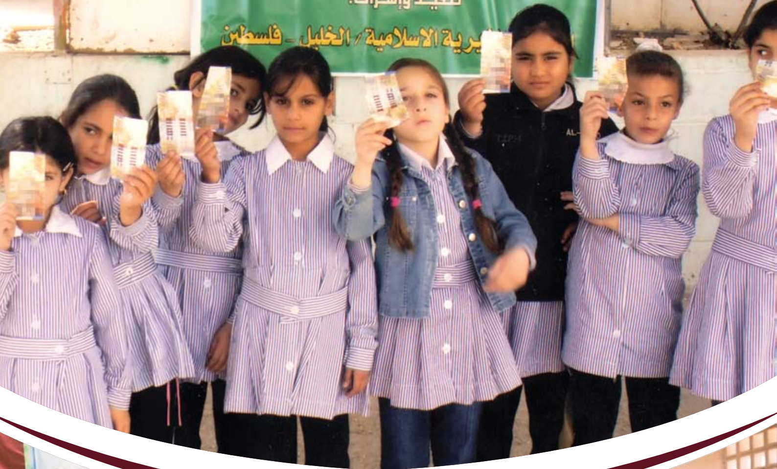
بعض أيتام المؤسسة بفلسطين