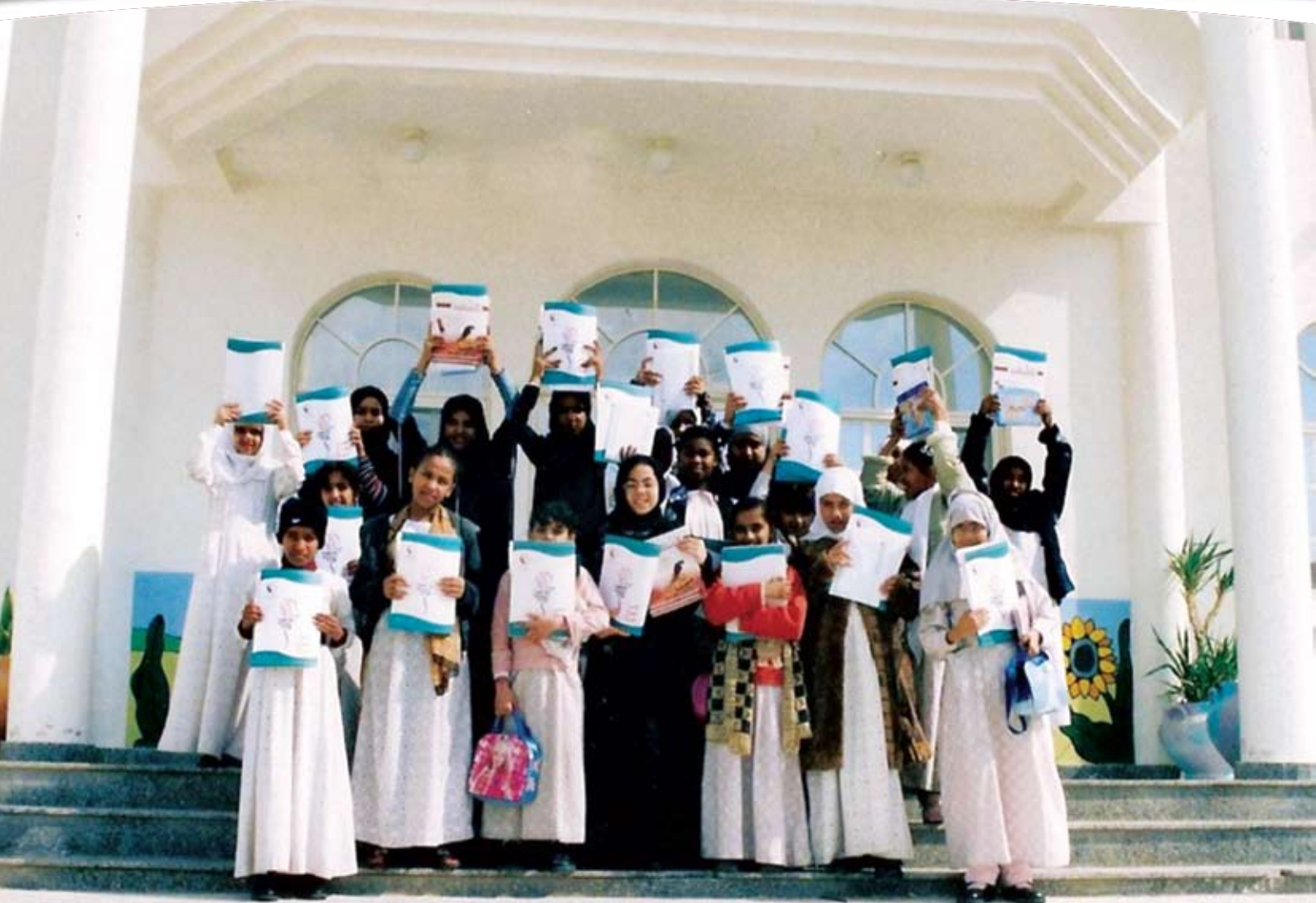
مركز الكوكبة الصيفي