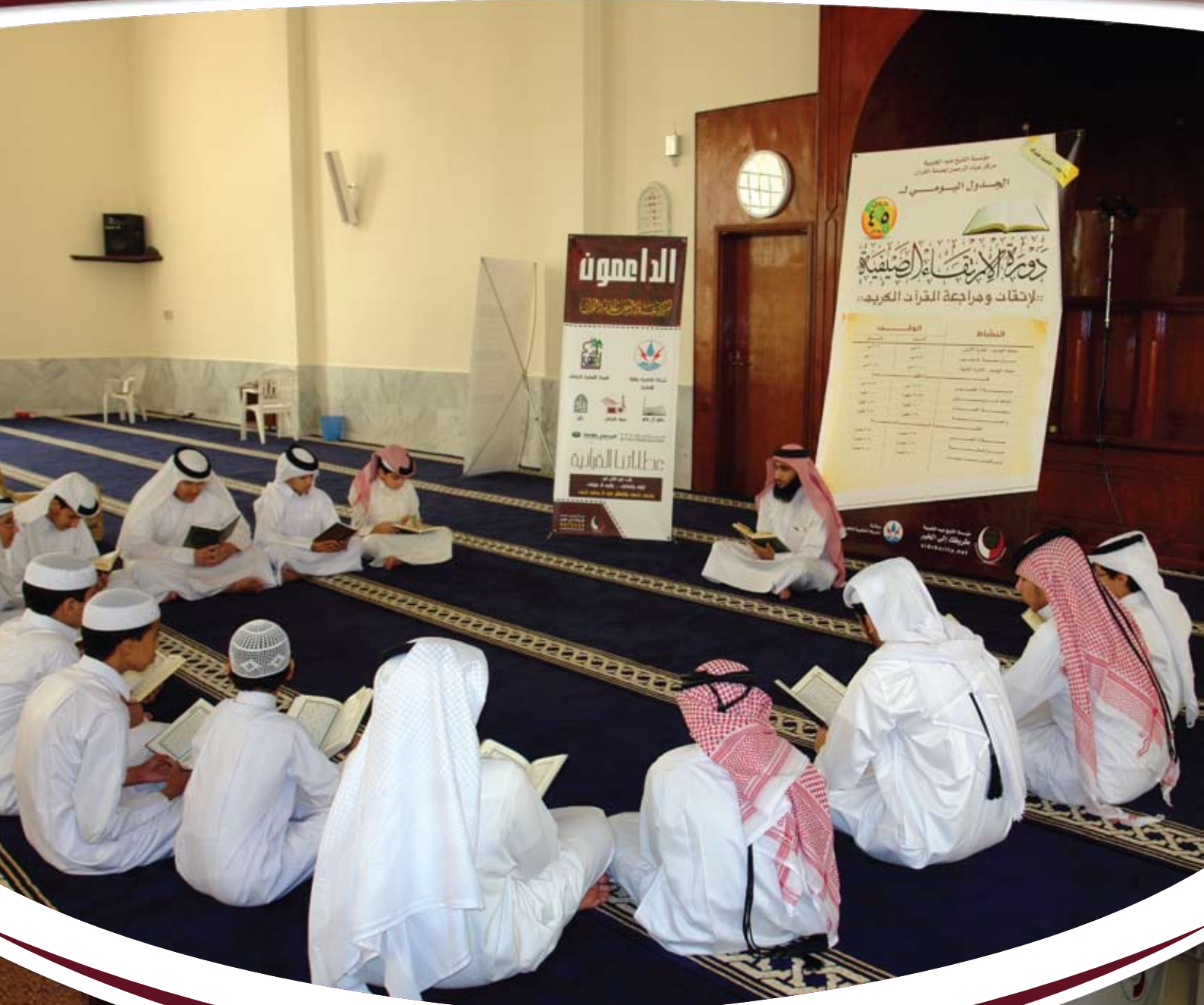
حلقة من دورة الارتقاء الصيفي