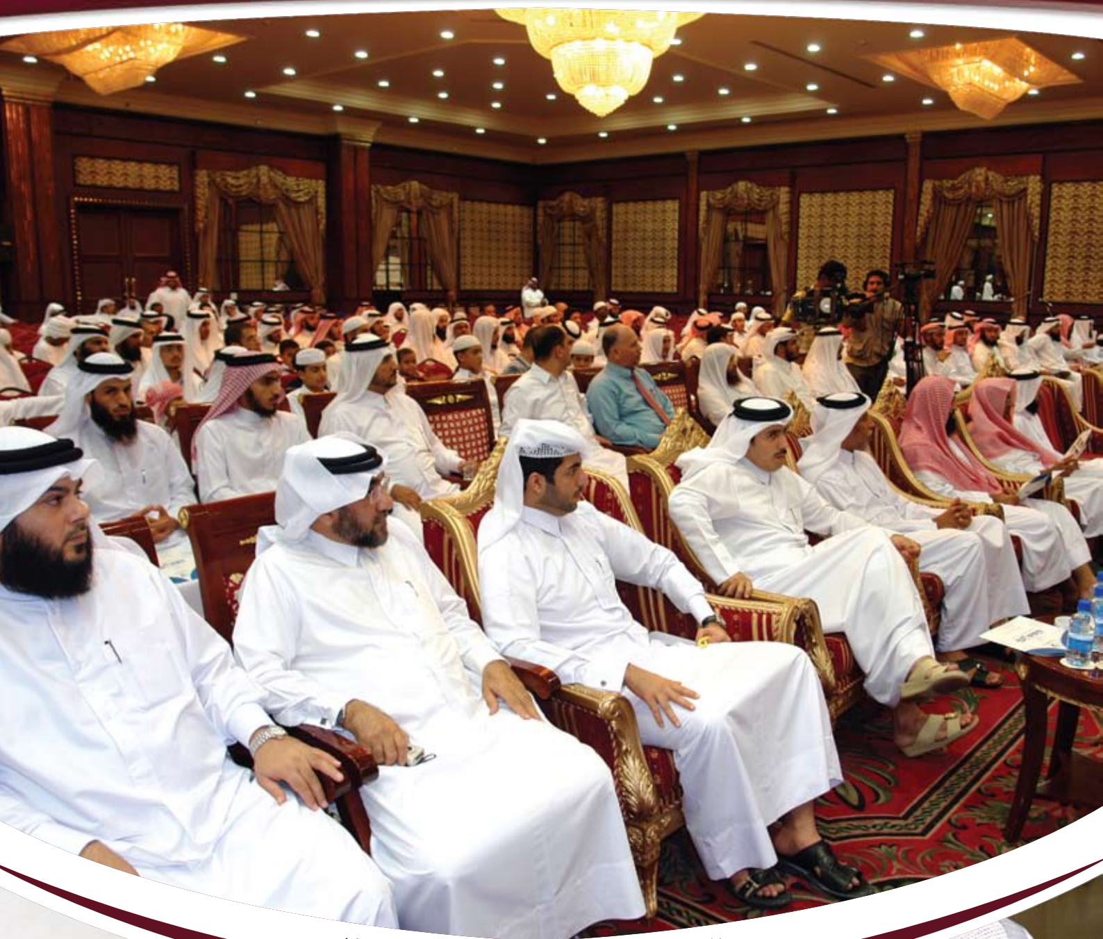
حفل ملتقى تعظيم كتاب الله بقاعة ريجنسي (الدوحة)