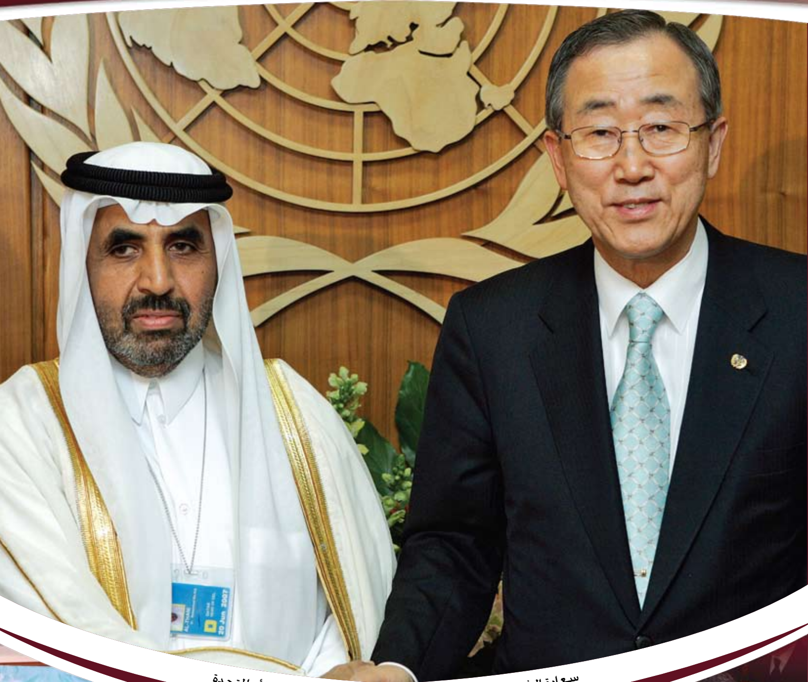
سعادة الشيخ الدكتور محمد بن عبد آل ثاني مع الأمين العام للأمم المتحدة