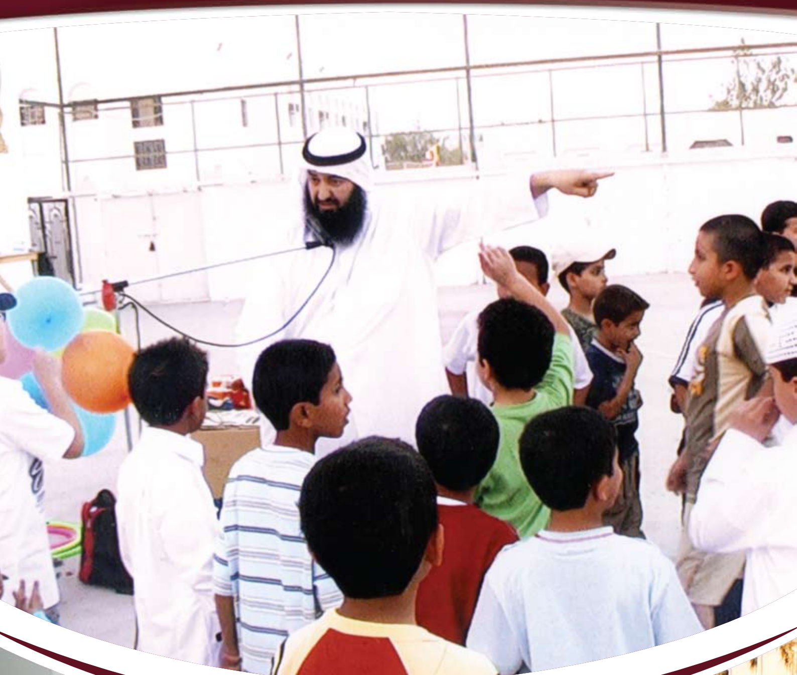
برنامج اجتماعي للأطفال