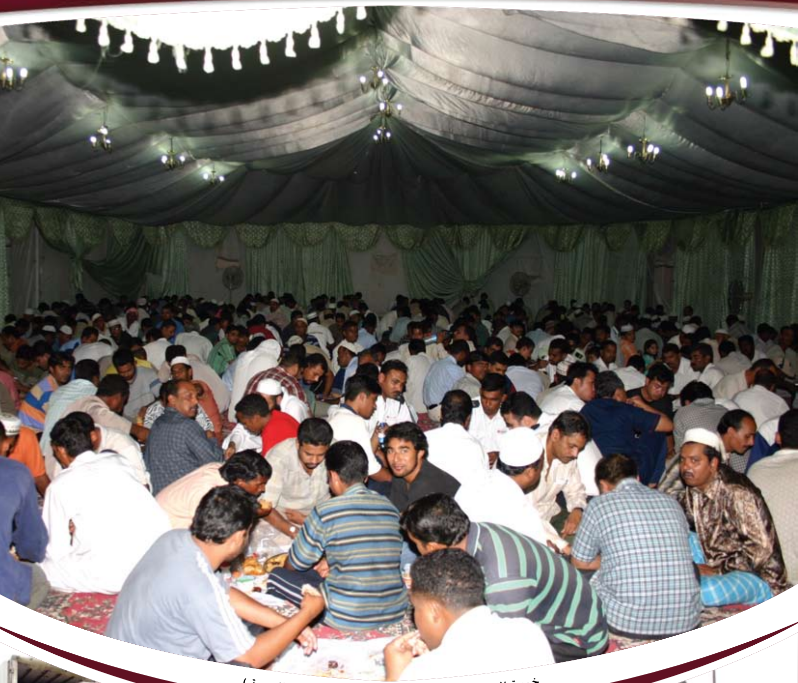
خيمة إفطار صائم قرب جامع عبد الله عبد الغني (الدوحة)