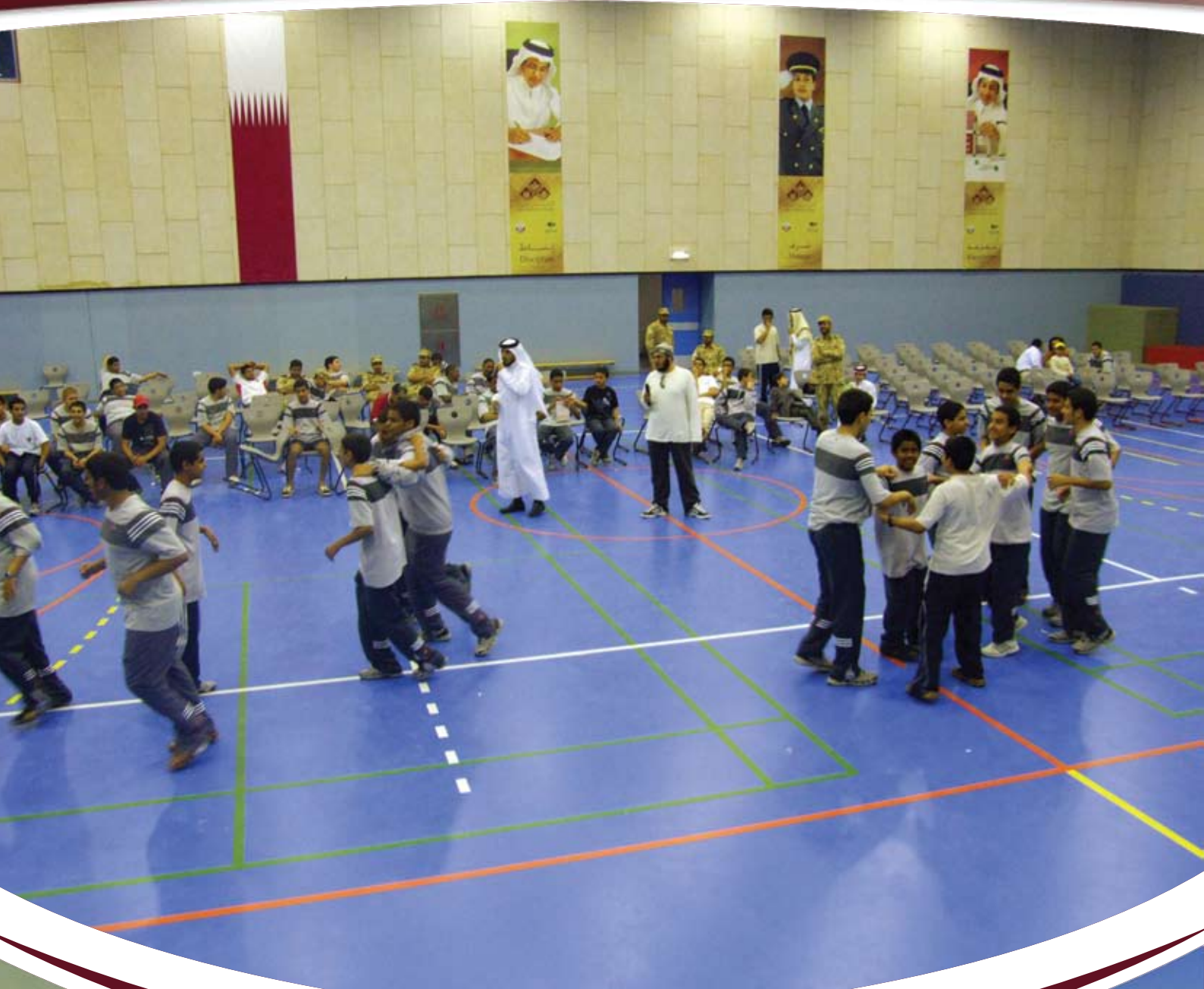
برنامج ثقافي وترفيهي لمنتسبي أكاديمية قطر للقادة