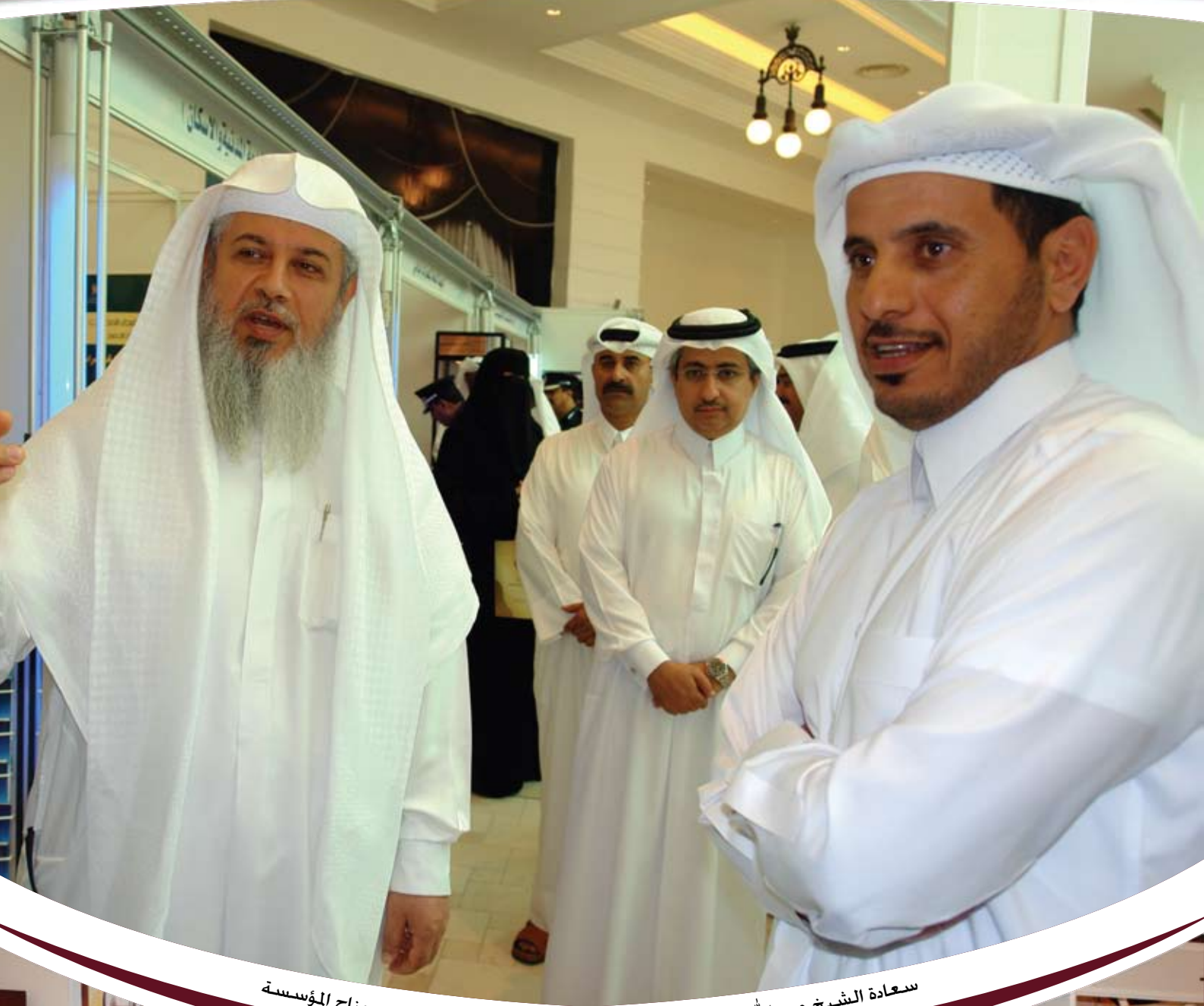
سعادة الشيخ عبد الله بن ناصر آل ثاني وزير الدولة للشؤون الداخلية يزور جناح المؤسسة