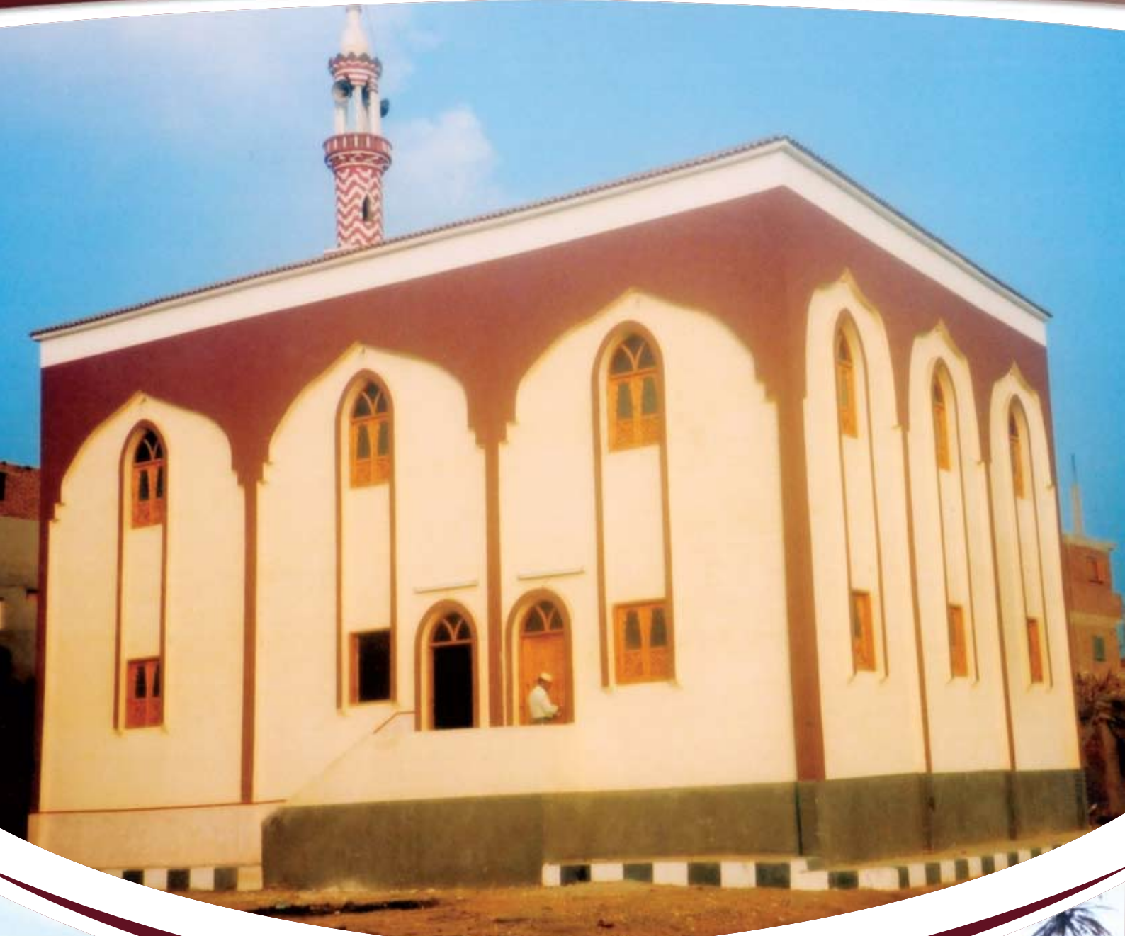
أحد المساجد التي تم إنشائها بمصر